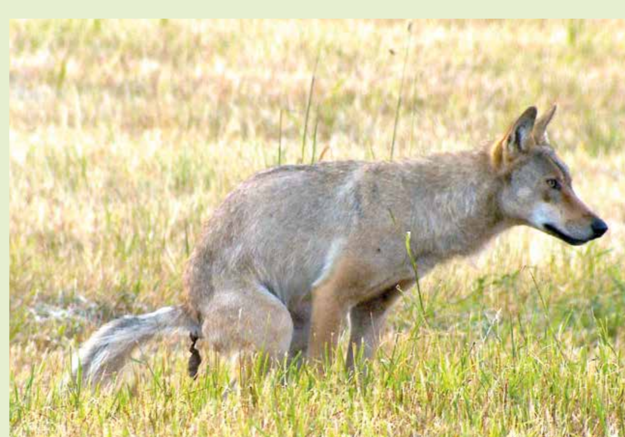
Wölfe markieren ihre Reviere mit „Duftmarken“ in Form von Urin oder Kot. Gleichzeitig gelten diese Hinterlassenschaften als gute Nachweismethoden, die die WolfsforscherInnen einsammeln und analysieren.