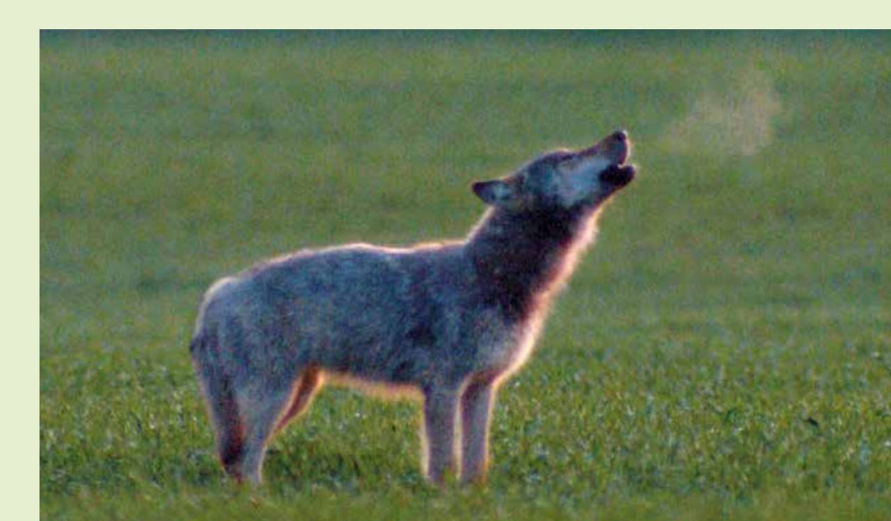
Wolfsheulen fungiert als wichtiger Kontaktlaut über größere Distanzen und dient dem Zusammenhalt des Rudels. Innerhalb der Familie erkennen sich Wölfe individuell an der Stimme. „Verloren gegangene“ Rudelmitglieder finden so wieder zusammen.