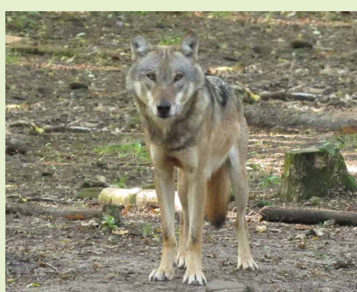
Einen Wolf in freier Natur zu Gesicht zu bekommen ist eine große Seltenheit. Meist haben die scheuen Tiere bereits die menschliche Witterung aufgenommen und treten eilig den Rückzug an. Junge Wölfe sind aber auch sehr neugierig, dann kann es sein, dass der Mensch - insbesondere wenn er in Begleitung eines Hundes ist - einmal genauer beäugt wird.

Die Wölfin „Sunny“ und ihre Schwester „Einauge“ gehören zur ersten Generation der Wölfe, die Anfang der 2000er Jahre in Sachsen in der Muskauer Heide geboren wurden. Sie gründeten anschließend eigene Rudel und sind die Mütter und (Ur-)Großmütter vieler in Deutschland geborener Welpen. „Einauge“ ist im Jahr 2013 als damals älteste freilebende Wölfin in Deutschland tot aufgefunden worden. Das Bild zeigt ihre noch lebende Schwester „Sunny“ im Alter von fast 10 Jahren.