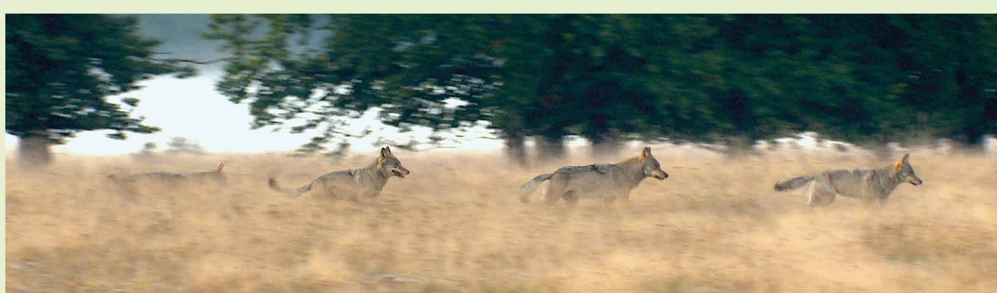
Junge Wölfe sind schon im Alter von 5 Monaten fast so groß wie ihre Eltern. Hier laufen die Elterntiere, eine Jahrlingschwester und ein 5 Monate alter Welpe hinter einander her.

Wölfe sind sehr soziale Tiere, sie leben in Familienverbänden, den sogenannten Rudeln. Ein Rudel besteht aus dem Elternpaar, den Welpen des selben Jahres und oft noch aus vorjährigen Geschwistern. Wölfe werden im Alter von 2 Jahren geschlechtsreif und wandern dann von Elternrudel ab, um sich ein eigenes Territorium und einen Partner zu suchen.