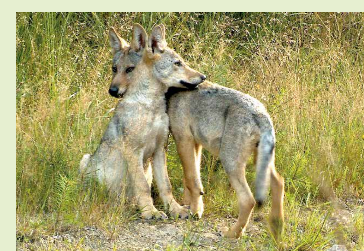
Wenn die Elterntiere auf der Jagd sind, bleiben die Welpen oft sich selbst überlassen. Dann bedeutet enger Kontakt unter den Geschwistern mehr Sicherheit.