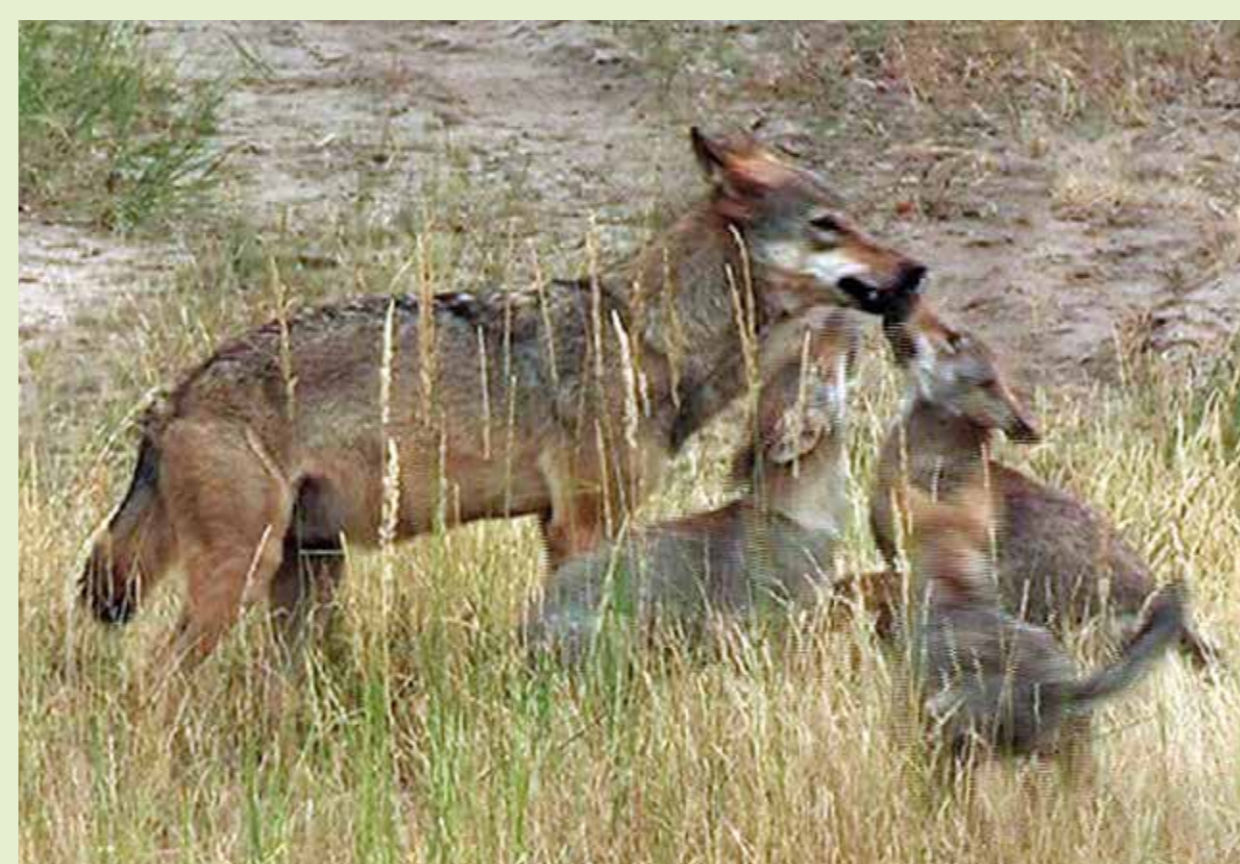
Altwölfe schlingen Futterbrocken herunter und transportieren sie zur Wurfhöhle, wo die Welpen bereits hungrig warten. Durch das Maulspaltenlecken der Jungtiere angeregt, würgen die Eltern die Futterbrocken wieder hervor. Auch ältere Geschwister beteiligen sich häufig an der Versorgung der Welpen.