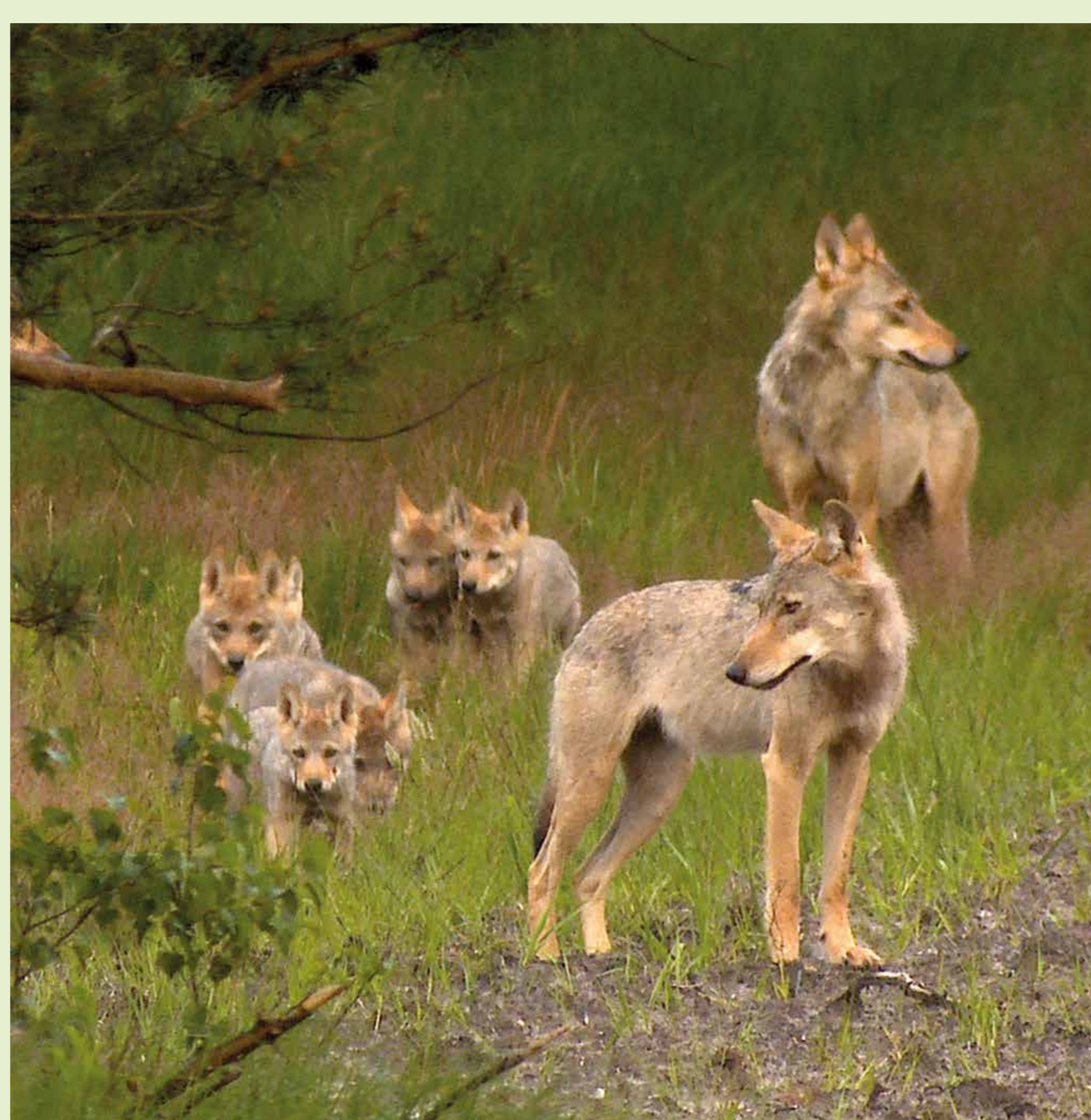
Wölfe sind sehr soziale Tiere. Im Mai werden die Welpen geboren, die im Alter von etwa 6-8 Wochen bereits Ausflüge mit ihren Eltern und älteren Geschwistern unternehmen. Dabei wird sich aber zunächst im Umfeld der Wurfhöhle aufgehalten, um sich bei Gefahr jederzeit in Sicherheit bringen zu können.

Quelle: http://www.wolfsregion-hautz.de/index.php/biologie-und-lebensweise