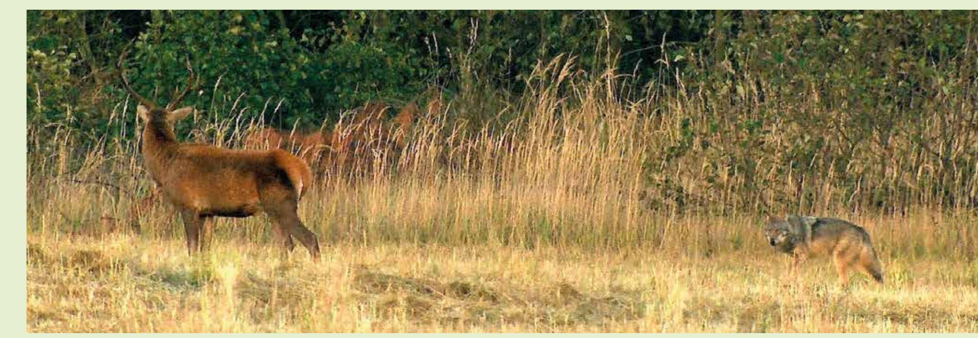
In der Zeit der Welpenaufzucht ist der Bedarf an Nahrung im Rudel besonders hoch. Seine Erfolgchancen, das Beutetier zu erlegen, muss der Wolf gut einschätzen, denn unnötige Energieverschwendung kann der effektive Hetzjäger sich nicht leisten.